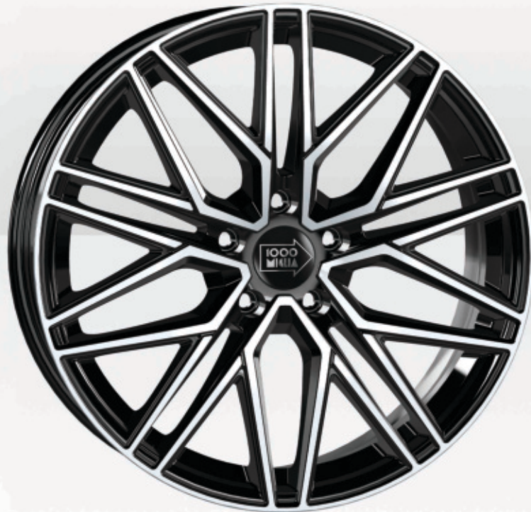
Gloss Black Polished

Universal Wheel / Electric & Hybrid Car Compatible / SUV Compatible