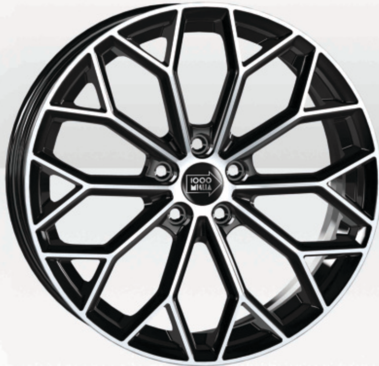
Gloss Black Polished

Universal Wheel / Electric & Hybrid Car Compatible / SUV Compatible