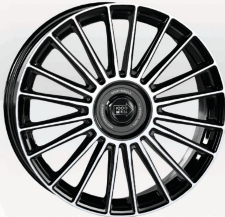
Gloss Black Polished

Universal Wheel / Electric & Hybrid Car Compatible / SUV Compatible