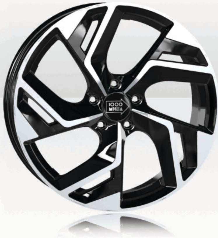
Gloss Black Polished

Universal Wheel / Electric & Hybrid Car Compatible / SUV Compatible